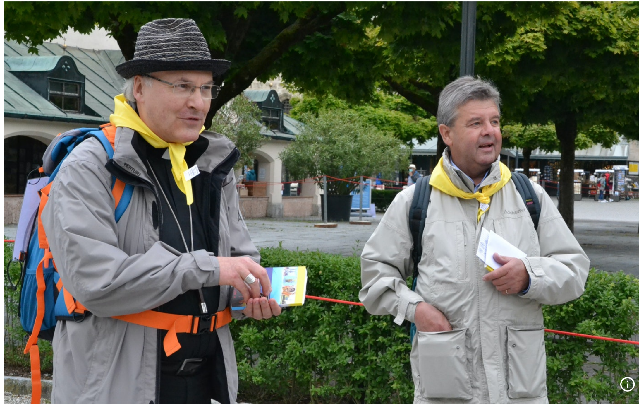
Regensburgs Bischof Rudolf Voderholzer und Pilgerleiter Bernhard Meiler pilgerten am Pfingstsonntag 2020 nach Altötting.

Heuer war alles anders – aufgrund der Corona-Krise war das „pfingstliche Pilgergesicht im Herzen Bayerns“ völlig verändert: Alle größeren und auch kleineren Fußpilgergruppen im Vorfeld waren abgesagt worden, nur Einzelpilger oder Familien kamen, darunter auch Regensburgs Bischof Rudolf Voderholzer. Und trotz der gewaltig minimierten Pilgerzahl, die es vom 30. Mai bis 1. Juni zur Gnadenmutter nach Altötting zog, war auch dieses Jahr das Wirken des Heiligen Geistes spürbar.